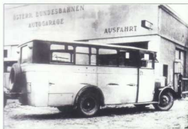
Bus der Gablitzer Linie um etwa 1930 vor der Garage in Hütteldorf

Quellenangabe: Festschrift „90 Jahre erste Autobuslinie in Österreich“, Fotos und AK von Hr. F. Vormauer.