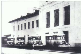
Vor dem Bahnhof in Hütteldorf um 1933